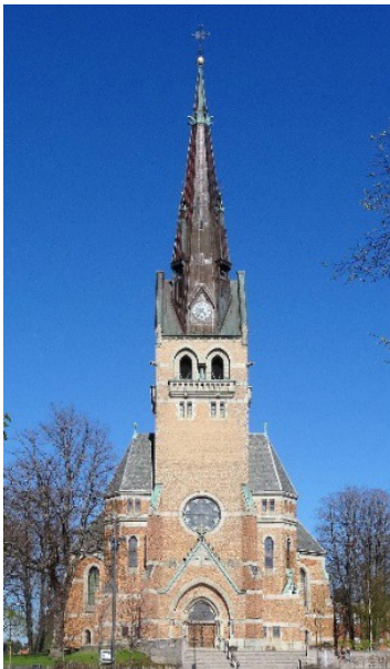
Gustav Adolfs Kyrka

Manlig partner: Högtidsdräkt (frack med vit väst, kaftan eller godkänd uniform).